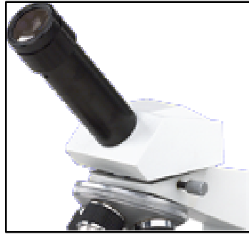
Cabezal Monocular B3-3001

Al ordenar, por favor indique cual adaptador necesita.