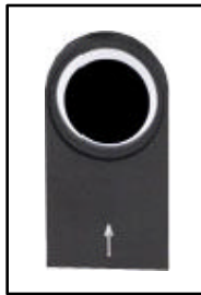
Accesorio para Campo Oscuro B6-8906