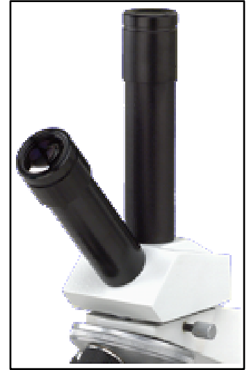
Cabezal Monocular Doble para la Docencia B3-3002