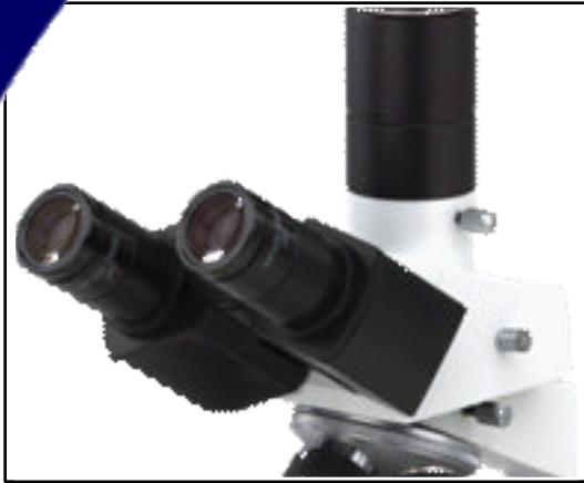
Cabezal Trinocular B3-3005

Los cabezales trinoculares ofrecen una variedad de opciones, incluyendo tubo ocular, adaptador para fotografía digital, fotografía de 35mm y video.